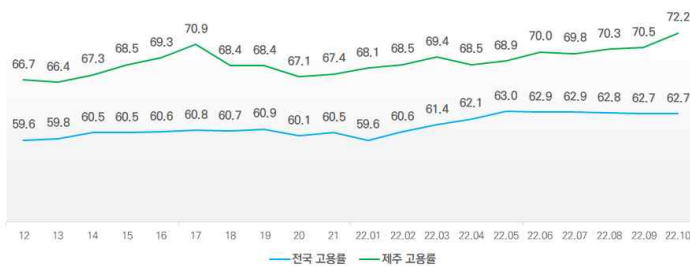
<2012~2022년 전국 및 제주 고용률 추이>